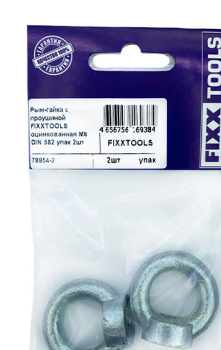
Пак. S- 1, 2шт.