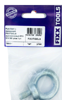
Пак. S- 1, 2шт.