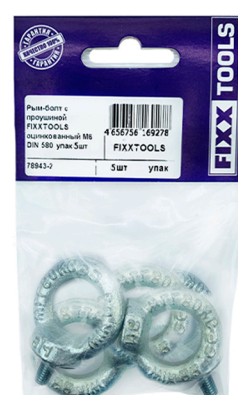
Пак. M- 5, 10шт.