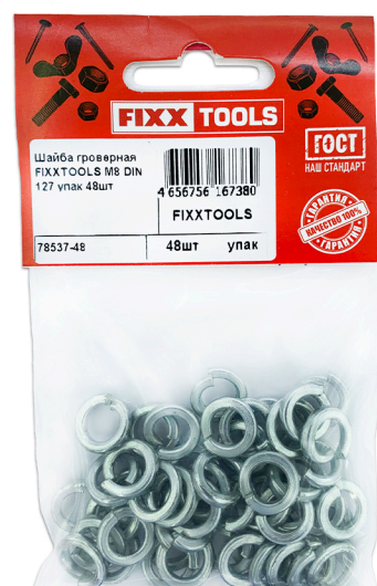
Пак. M- 12, 16, 20, 24, 36, 60шт.