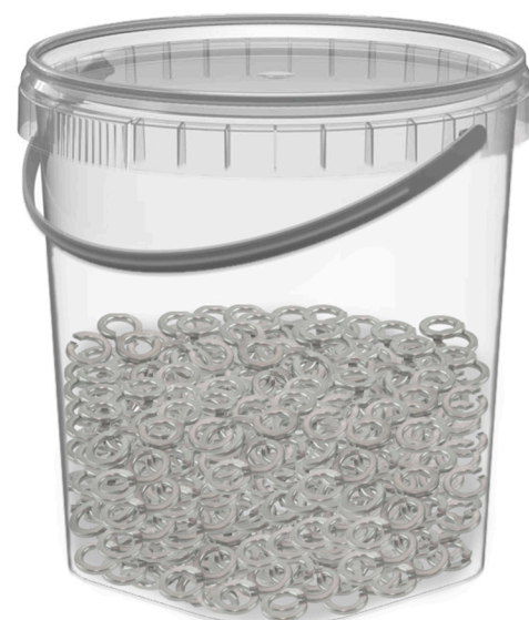
Ведро -0.5, 1кг