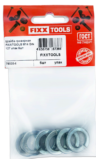
Пак. S- 2, 4, 6шт.