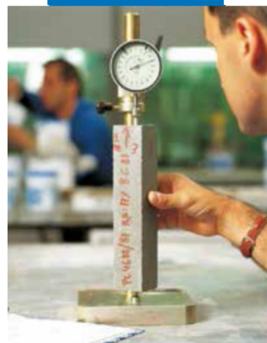
Определение расширения в стесненных условиях согласно итальянской норме UNI 8997/89