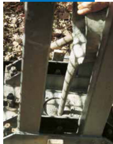
Анкерное крепление с помощью раствора Mapefill