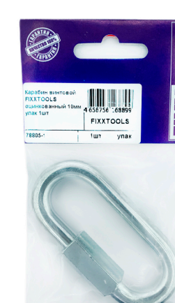
Пак. S- 1, 2, 5шт.