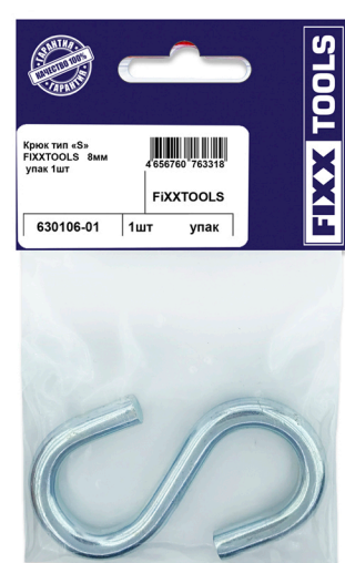
Пак. S- 1, 2шт.