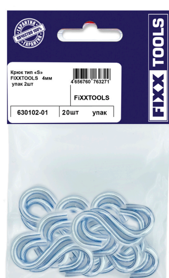
Пак. M- 20шт.