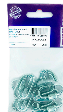
Пак. M- 10, 20шт.